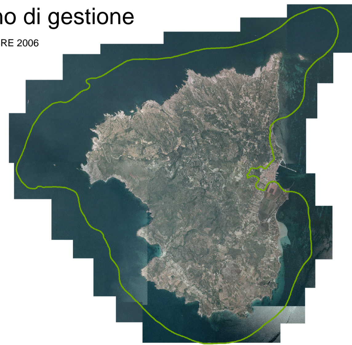
Tav. 5.1 - Rapporti tra copertura vegetazionale e Habitat di Interesse Comunitario